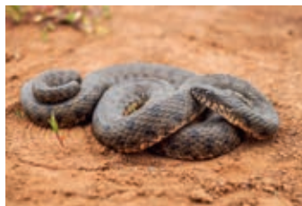
ОКТАБРЬ - Водяной уж