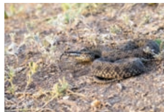
НОЯБРЬ - Степная гадюка