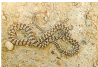
МАЙ - Разноцветный полоз