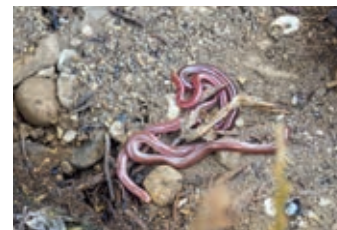
АВГУСТ - Червеобразная слепозмейка