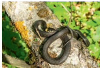
ФЕВРАЛЬ - Уж обыкновенный