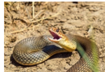
АПРЕЛЬ - Каспийский полоз