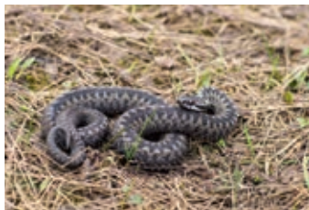
ЯНВАРЬ - Гадюка обыкновенная