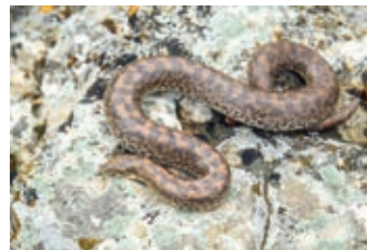
МАРТ - Западный удавчик