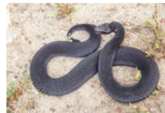
ДЕКАБРЬ - Гадюка обыкновенная