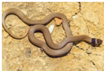
ИЮНЬ - Ошейниковый зяренис